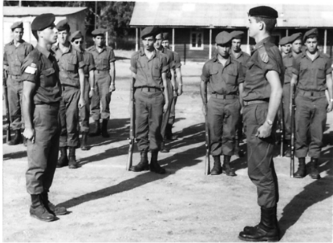
סמל המחלקה בדום מתוח

כמו רבים שהיו בתותחנים גם אני לא שומע הכל וחירש חלקית מן הצבא. בכלל לא הייתה אז מודעות לסכנה של התחרשות, ולצורך בשימוש בפקקים או באוזניות. מה גם שבתפקיד שלי הייתי מפקד הצוות והייתי צריך להיות כל הזמן בקשר טלפוני עם הקצין האחראי על הסוללה. הקצין היה מעביר אלי בקשר את כל הפקודות להיכן לכוון ומה הם הפרטים והנצ. של המטרה וצריך גם לשמוע אותו ולהיות מאד זהירים בחישוב המסלול ובמספרים, לכוון ואחרי הפגז הראשון לשפר דיוק לפי ההוראות "קצת ימינה", "קצת שמאלה" ולהמשיך בירי. הייתי בסדיר בתותחנים נגררים "155. התותחנים הכי כבדים בצה"ל. תותחנים אלו, ה"הוביצרים" היו רק בגדוד 43. הם פותחו ויוצרו במלחמת העולם השנייה. הם היו נגררים על-ידי סמיטריילר גדול וכאשר היה צריך להזיז אותם זה היה "סיפור מן ההפטרה". אלו התותחנים הכי עתיקים שהיו לנו, ואני הייתי מדריך עליהם. אח"כ הפכו אותם מנגררים לנישאים על מרכב של טנק. בשרות המילואים המשכתי ולמדתי להפעיל תותחנים אחרים שהוכנסו לצה"ל. ככה שרתתי במלחמת ששת הימים וגם בהתשה ובמלחמת יום כיפור.