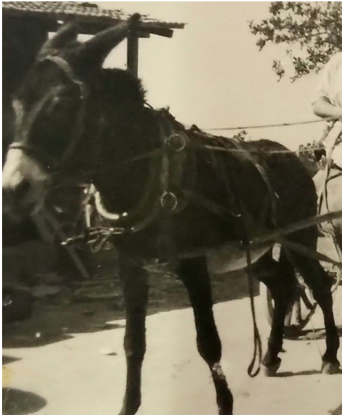
מאקי מוכן לפעולה

זו הייתה אחת המשימות היומיות החשובות כי לא היה מקפיא בקיבוץ. הבאתי את מנת הקרח היומית ואת הדואר מזיכרון יעקב. זה היה תפקיד חשוב מאד ואני זוכר את הסיפוק שהיה לי לצד האחריות. בהחלט קבלתי את הטוב בחינוך לעבודה.