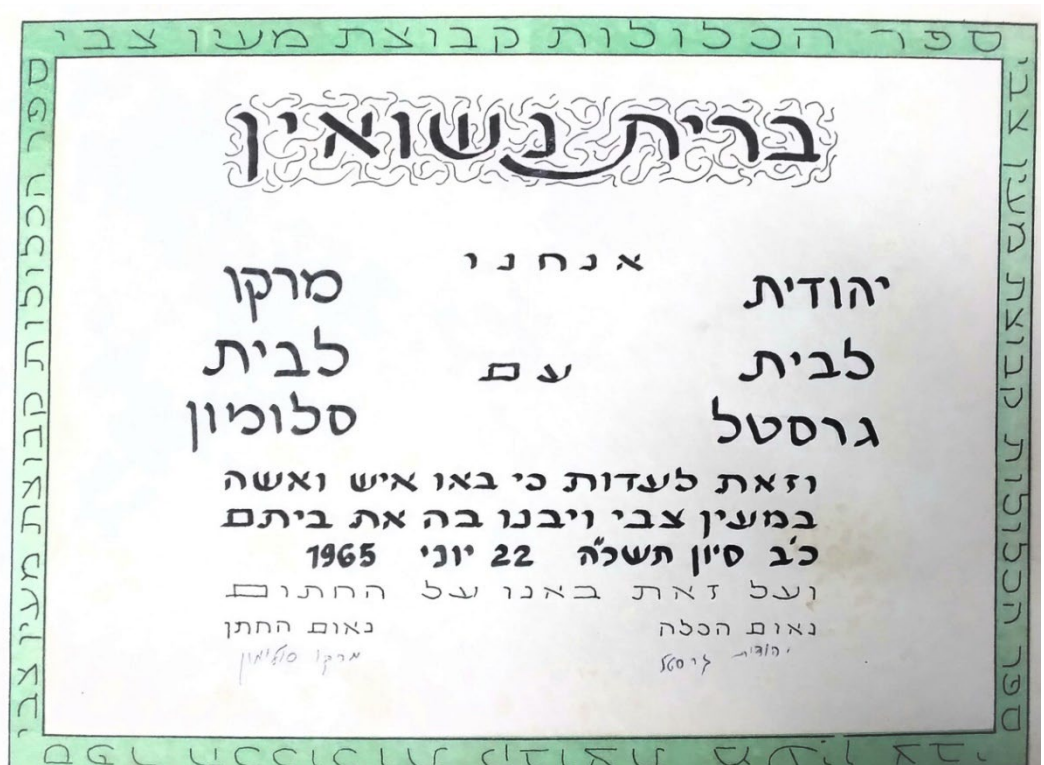
חתימתנו בספר הכלולות הראשון