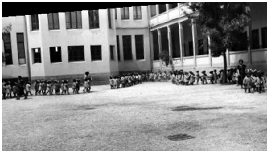
הכניסה לכיתות מן החצר הגדולה של ביה"ס אליאנס דמשק 1937 'מכאן ומשאם' חוב. 11, 2010

פעם אחת הילדים מביה"ס הלכו אלינו הביתה וסיפרו לאבא שהיא מתעללת בי. אבא בא לביה"ס ועשה מזה "סקנדל" גדול, אבל זה לא שינה הרבה. אף אחד לא התרגש יותר מידי... לא הייתה לי בעיה של לימודים, רק שפה זרה הייתה הקושי.