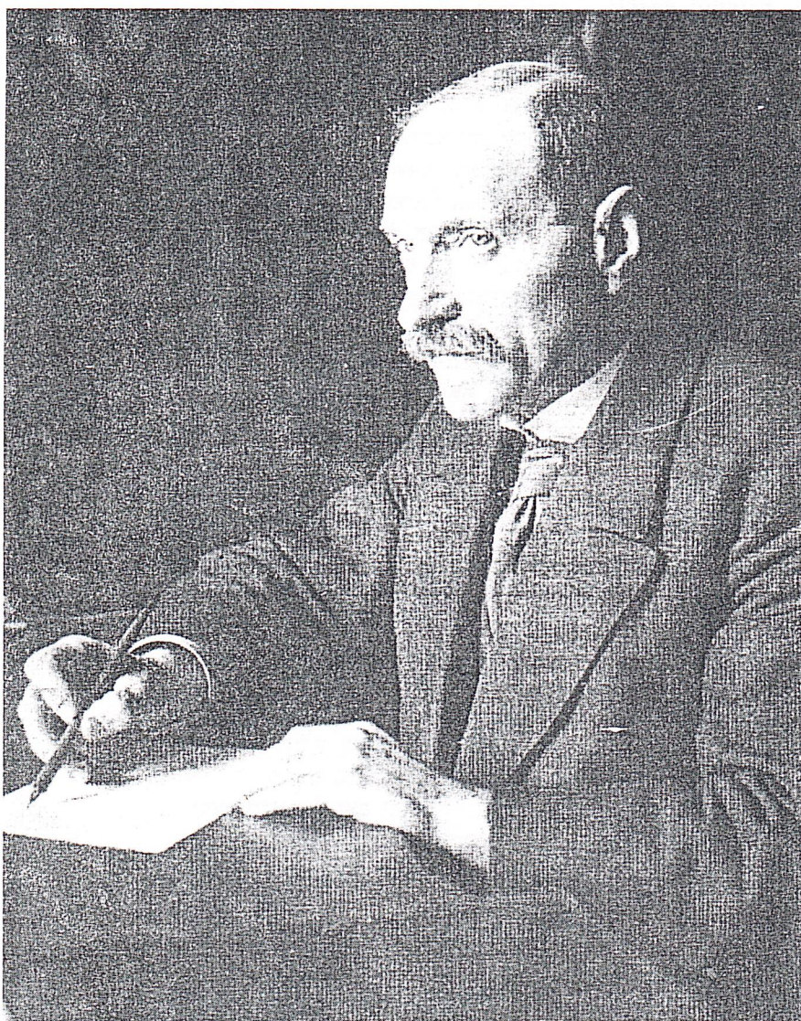
אחד האנשים השנואים ביותר על הימין המיליטנטי. הוגו האזה 1918